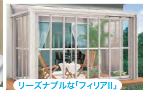
リーズナブルな「フィリアII」