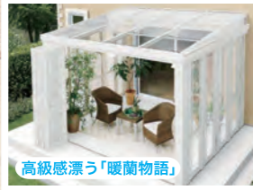
高級感漂う「暖蘭物語」