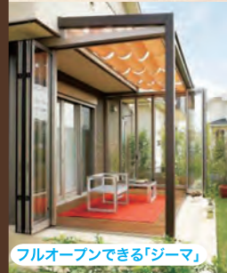
フルオープンできる「ジーマ」