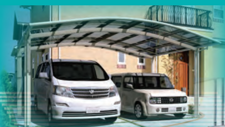
一般的なタイプのカーポートです。

カーポートを取り入れたトータルデザインはもちろん カーポート単体工事もお気軽にご相談ください。