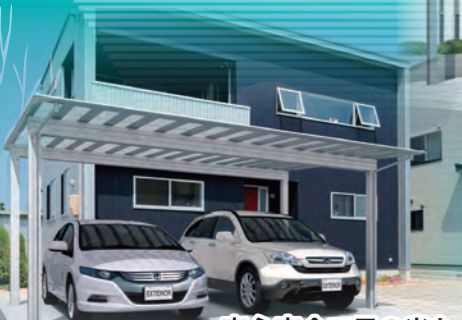
安心安全で日の光も取り入れるカーポートです。