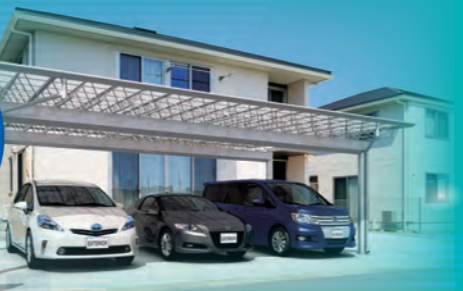
抜群の存在感で、明るく開放的なM シェードは、カースペースだけでなく お家全体を豪華に感じさせます。

お客様のご希望のデザイン や価格帯、敷地状態など からおすすめの商品を ご提案いたします。