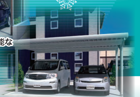
安心安全で雪に強い折板カーポートです